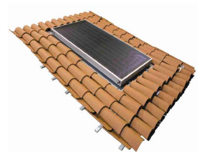
IN-ROOF (Integrado en cubierta)