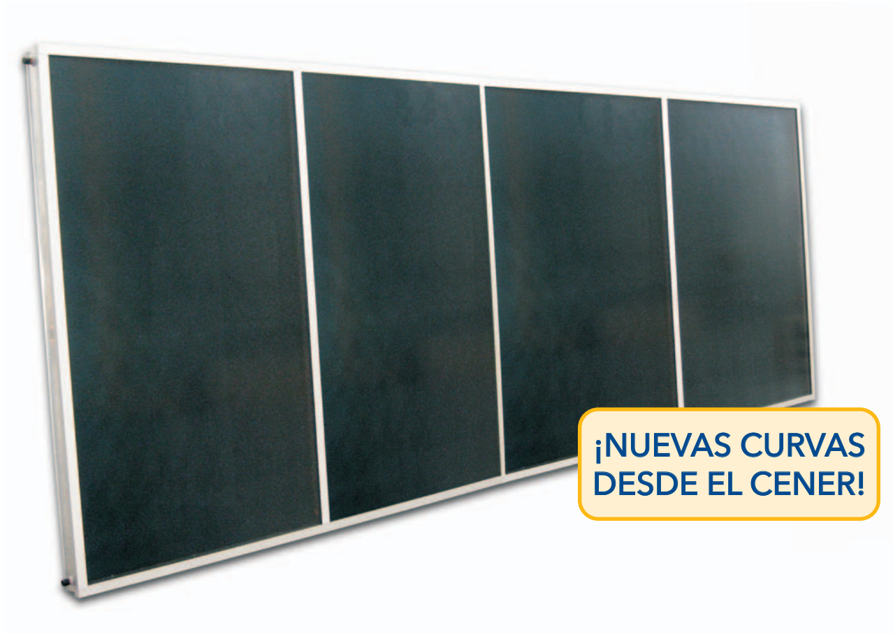
Fig 1 El captador solar LBM - La solución más ventajosa para grandes instalaciones solares