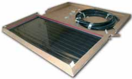
1.- Captador + tubería flexible